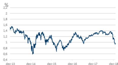
Inflatieverwachting Europa nog ver onder doelstelling ECB

De drie, voor de financiële markten, meest bepalende gebeurtenissen in 2018 waren de door de Amerikaanse president Trump ontketende handelsoorlog, alle onzekerheid rondom de brexit en de nieuwe regering in Italië. De harde strijd over de handelsrelatie tussen China en de VS had een sterk negatief effect op beurzen in het tweede deel van 2018, toen steeds meer bedrijven aangaven hier last van te ondervinden en dientengevolge hun winstverwachting aanpassen.